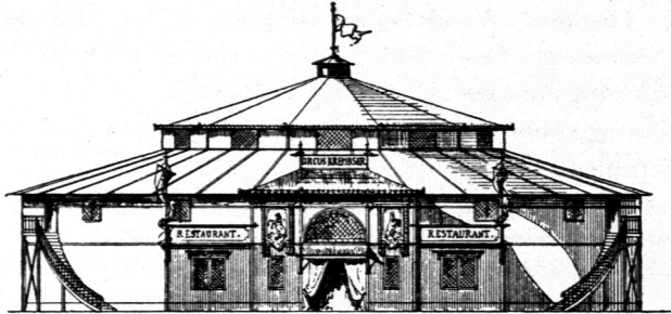
Anficht der Eingangsseite.