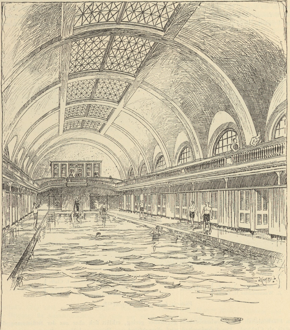
Schwimmhalle im öffentlichen Bad zu Brookline 214 ).