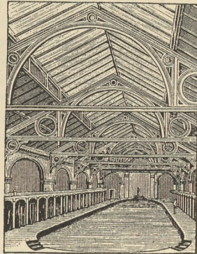
Fig. 175. Innenansicht der Schwimmbhalle A.

links das Frauen-Schwimmbad. Unter den Wannenbädern liegt die Wäscherei und über denselben im Obergeschosse (siehe die Tafel bei S. 169) das römisch-irische Bad. Das Obergeschosse enthält ferner zu Seiten der Schwimmbäder — nach der Mitte zu — noch je 4 Wannenbäder für Männer und Frauen. Die Auskleidezellen des Männer-Schwimmbades I. Classe und des Frauen-Schwimmbades liegen je zur Hälfte auf Galerien. Beide Schwimmhallen haben innere und äußere Umgänge; letztere sind jedoch auch hier nicht ringsum geführt. Das Männer-Schwimmbad II. Classe liegt in gleicher Höhe mit den beiden anderen Schwimmbädern (vergl. den Durchschnitt auf der Tafel bei S. 169). Die bereits erwähnte Treppe führt auf die Galeriehöhe dieser Schwimmhalle. Hier liegen die offenen Auskleideplätze mit verschließbaren Schränkchen für Kleider u. dergl. Zwei Treppen führen zu beiden Seiten von hier herab zu den Reinigungsbädern und dem Umgang des Schwimmbeckens.