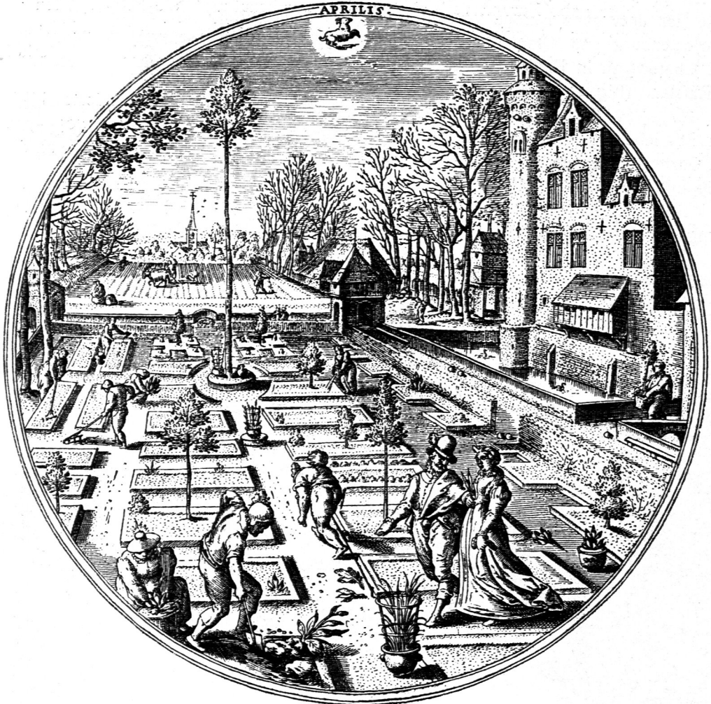
Holländischer Garten nach Hans Bol (1534—93 17) .