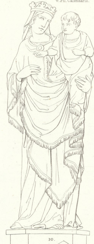
Madonna von Nino Pisano.