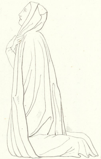
Vom Dogenpalast zu Venedig v. Fil. Calendario. 11.