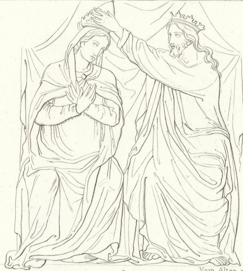
Vom Altar aus S. Francesco zu Bologna. 2.