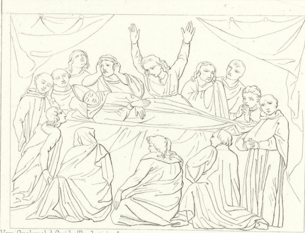
Vom Grabmal d. Guido Tarlati in Arezzo. 4.