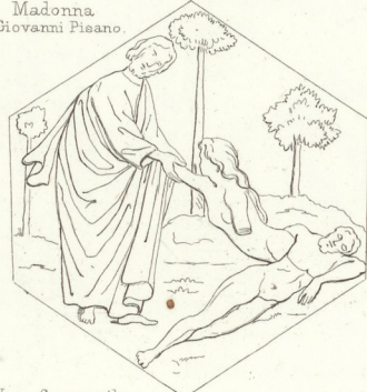
Vom Campanile des Doms zu Florenz. 6.