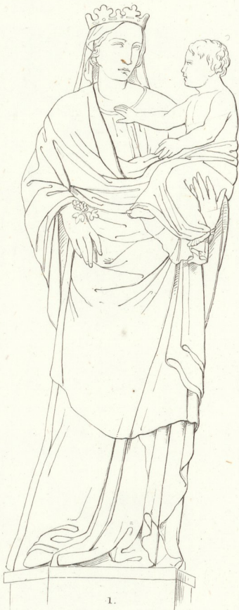
Madonna von Giovanni Pisano.