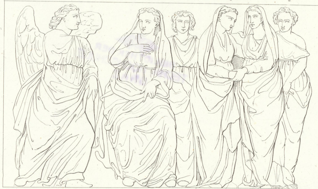
Von der Kanzel in S. Giovanni zu Pistoja. Verkündigung und Heimsuchung. 5.