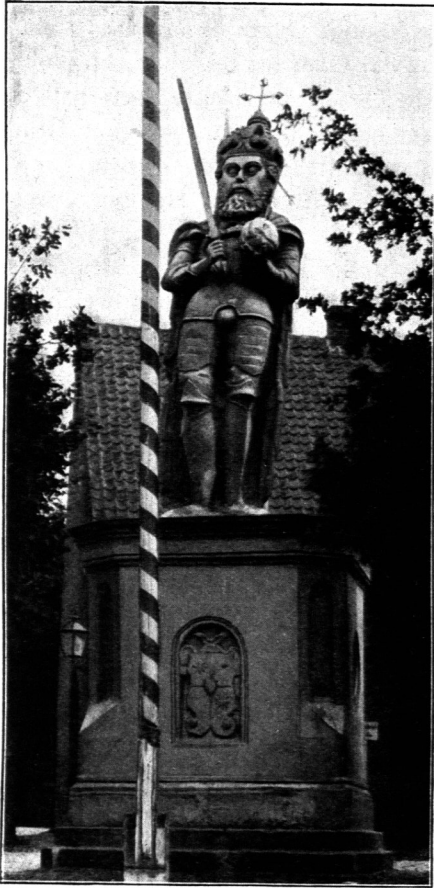
Rolandfäule zu Neuwedel.