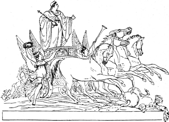
Modell für die Quadriga auf dem Thorweg am Hydepark-Corner zu London.