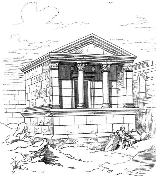
Grabmal zu Ruweha.

Giebeldach und einer sehr kleinen Thür, die zur Grabkammer im Innern führte. Dort stand der goldene Sarg des Eroberers, goldene Sessel und Geräte daneben, welche Alexander d. Gr. noch vorgefunden und unberührt gelassen hatte; kostbare Gewänder und Teppiche babylonischer Arbeit dienten zu weiterem Schmucke. Ein Peribolos mit Säulengang umgab das Grabgebäude (siehe Fig. 52, S. 370).