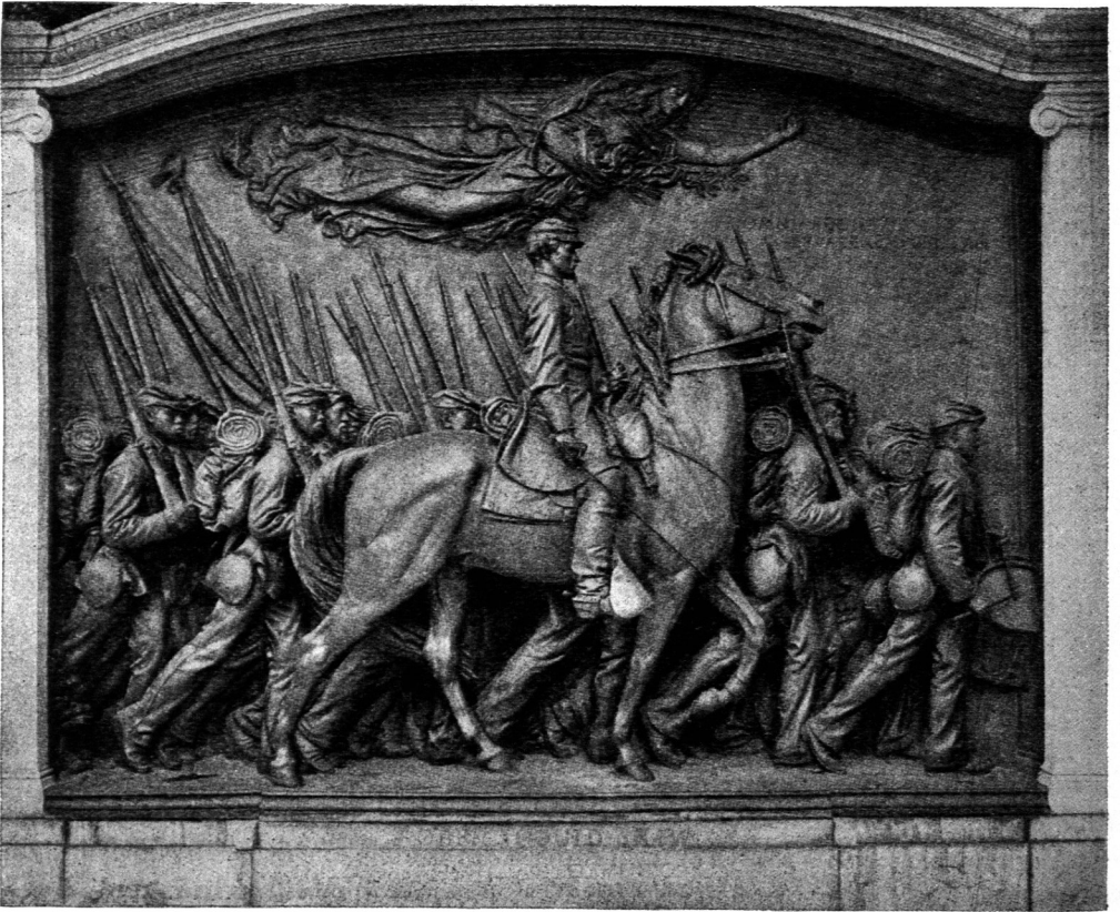
Denkmal für den Oberft Robert Gould Shaw zu Boston 246) .

Arch.: Mc Kim, Mead & White ; Bildh.: Augustus St. Gaudens .