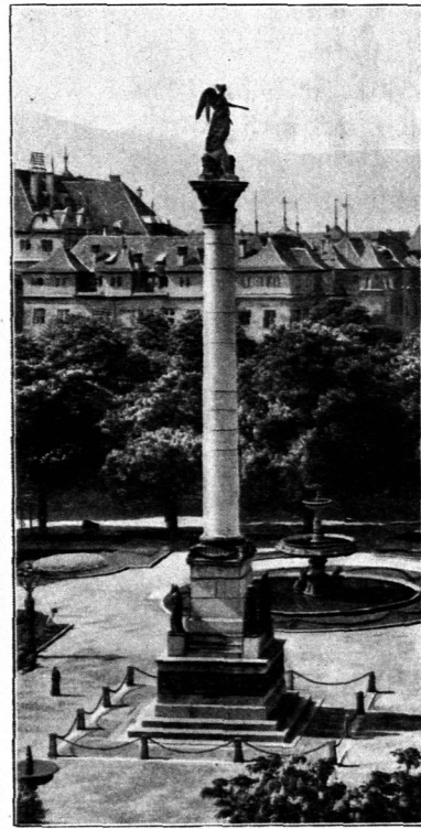
Jubiläumsäule auf dem Schloßplatz zu Stuttgart.

tischem Hallenunterbau und steigt bis zu einer Gesamthöhe von 37,50 m an. Es ist ein gemeinsames Werk der Bildhauer Heinrich Düll , Georg Pezold und Max Hellmaier in München.