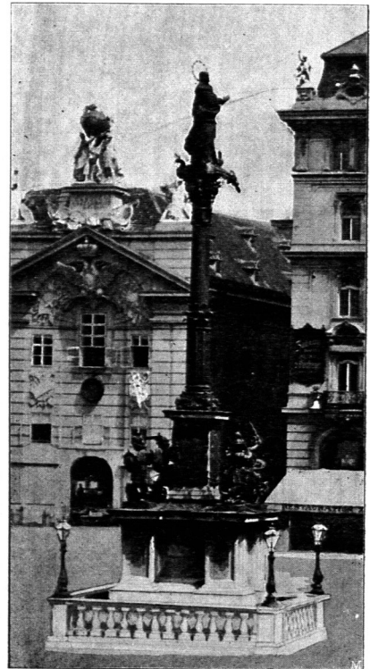
Mariensäule zu Wien. Bildh.: Balthasar Herold .

in freier Weise mit den Hintergrundarchitekturen verwebt, vielfach in Verbindung mit dem Kuppelmotiv; denn Trajan -Säule und Pantheon sind die beiden römischen Bauwerke, welche für alle Folgezeit ein außerordentliches Nachleben gehabt haben. Auf einem Bilde des Paris Bordone in den kaiserlichen Sammlungen zu Wien, welches einen Gladiatorenkampf darstellt, zeigen sich im Hintergrunde das Kolosseum, die Trajan -Säule und das Pantheon. Giulio Romano zeichnete die Trajan -Säule. Eine Rolle Federzeichnungen in Sepia in der Modena-Sammlung des Erzherzogs Franz Ferdinand von Oesterreich-Este stellt die Reliefs der Trajan -Säule dar und wird auf Giulio Romano als Urheber zurückgeführt. Am 28. April 1681 schreibt Baldinuzzi an den Marchese Vincenzo Capponi aus Rom von Cortona: » Riguardava alcune carte stampate di cattivo intaglio con disegni della Colonna Trajana fatti da Giulio Romano « 171) .