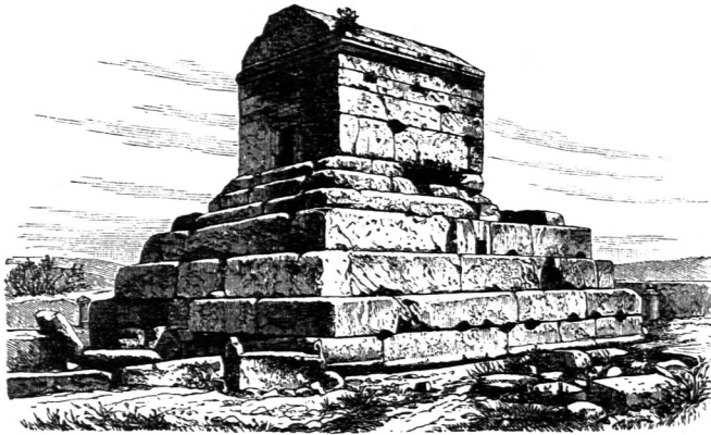
Grab des Kyros bei Mescheb-i-Murghab.

werden. Die strukturelle Behandlung des Obelisken, als aus rauhem Boffagemauerwerk gefchichtet, war ein Mittel, die naturgemäße Ungleichheit der gestifteten Steine künstlerisch zu verwerten.