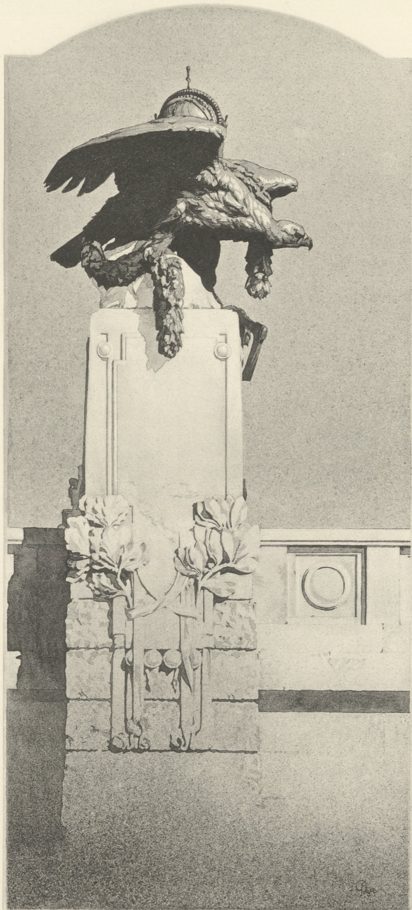
WIEN, VON DER HIETZINGER-BRÜCKE.

ARCHITEKT K. K. OBERBAURAT FRIEDR. OHMANN.