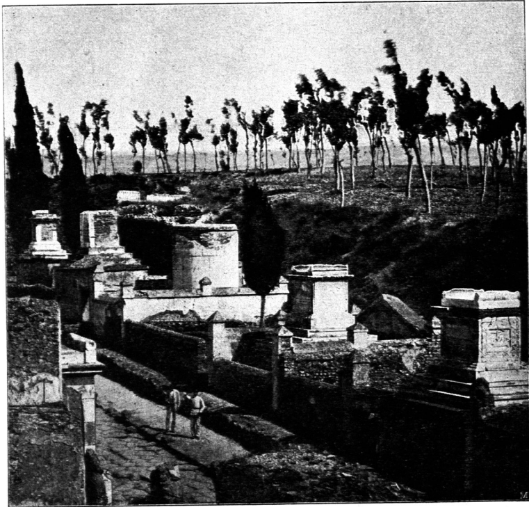
Gräberstrasse zu Pompeji.

Heidecharakter gegeben. Zwischen kleineren Findlingen, die dem mächtigen Steine vorgelagert sind, sind Wacholder, Krummholzkiefern u. s. w. angepflanzt.