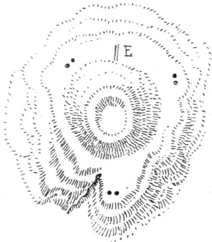
und bei Sefönk.

nommen, ohne dass indeffen Nachgrabungen Beweise für diese Annahme erbracht hätten.