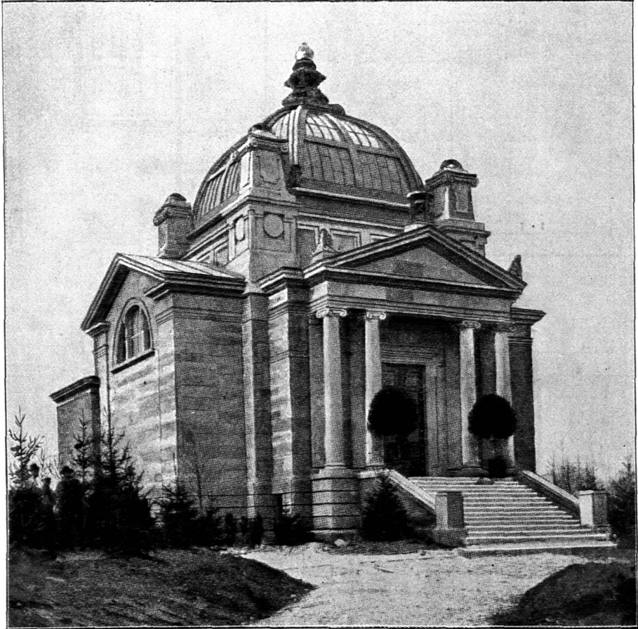
Leichenverbrennungshaus auf dem städtischen Friedhof zu Mainz 132) .