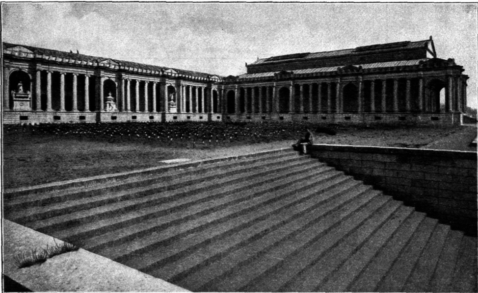
Hallengruftanlage auf dem Friedhof zu Meffina 94 ).