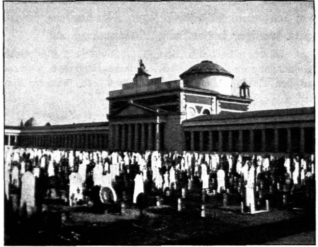
Anficht vom Gräberfeld aus.