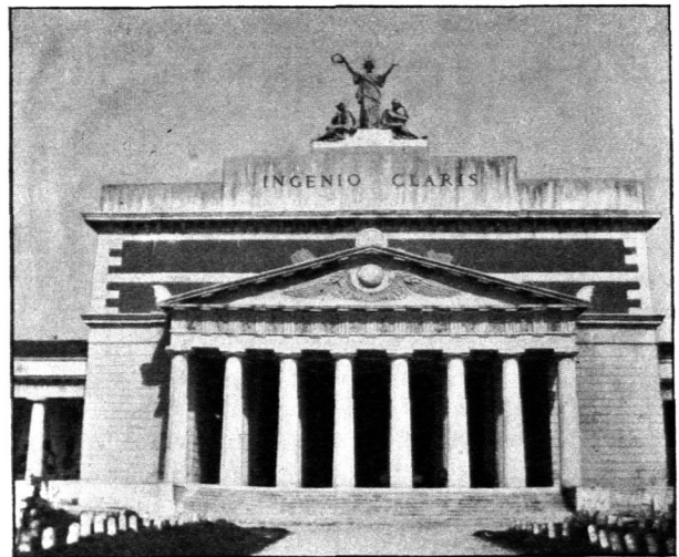
Eingangsportal vom Gräberfeld aus. Vom Campo Santo zu Verona.