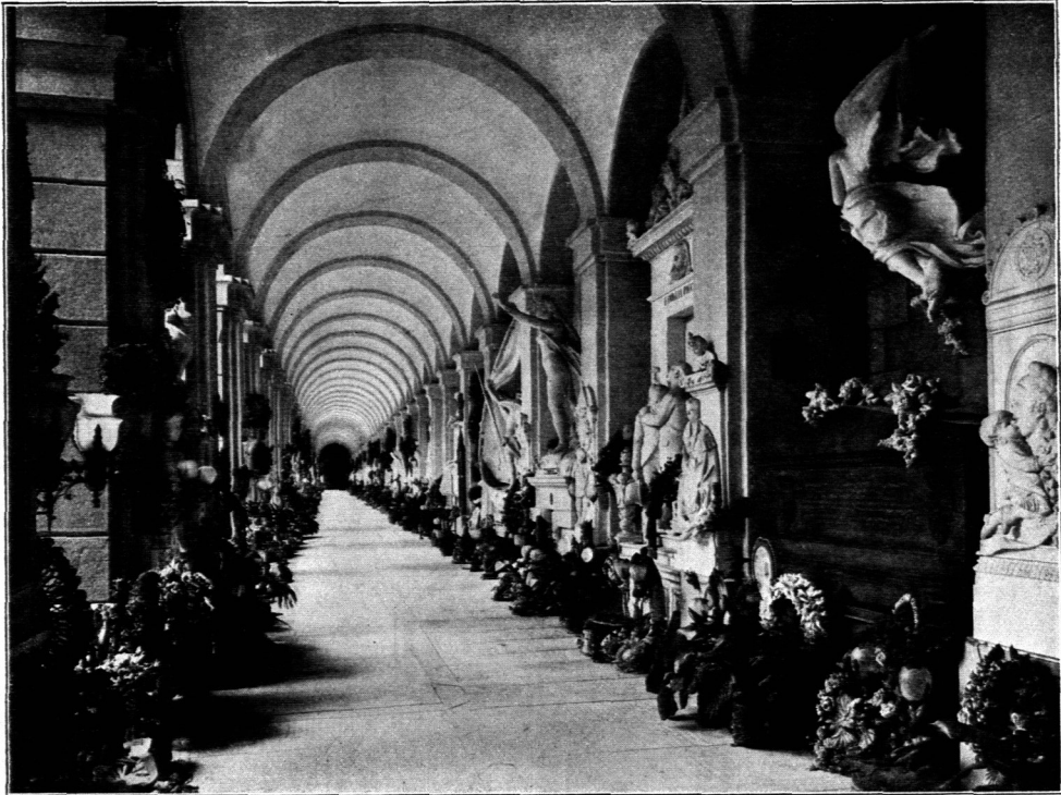
Innenansicht der Hallenbauten.