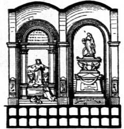
Längenschnitt durch die Kolumbarienhalle Skulpturenhalle auf dem Campo Santo zu Genua 89) .