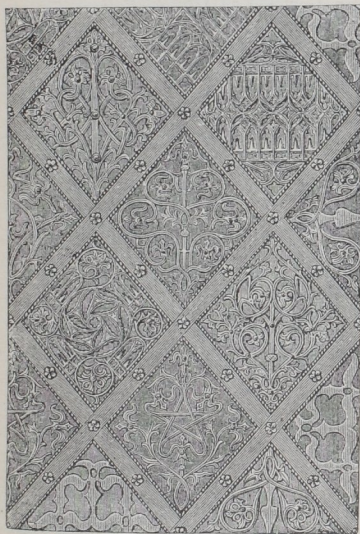
Von der Probsteikirche zu Bruck 132) .

weder nur die Holzoberfläche sehen oder sind, wie in Fig. 464 130) , einer Thür aus dem XIV. Jahrhundert, gleichfalls mit Rosetten verziert, welche in der Mitte fest genagelt und mit ihren Blattspitzen unter das Netzwerk geschoben sind.