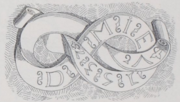
Spruchband auf der Unterseite einer Ruhebank von der Treppe im Schloß zu Tübingen 82 .