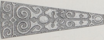
Von der Treppe im Segenwald'schen Haufe zu Strafsburg 69) .

geziert. Man hat aber an dieser Stelle auch ornamentalen Schmuck angebracht (Fig. 195 69) ) oder hat eine streifenartige Verzierung angeordnet, welche sich über