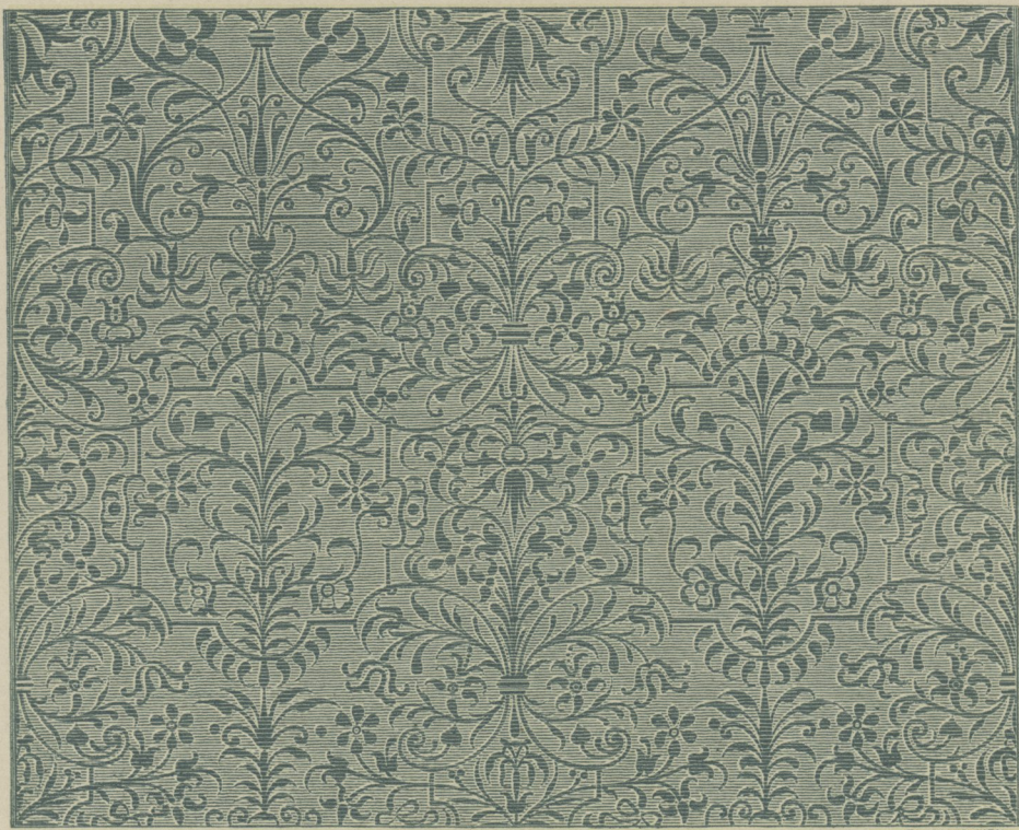
49] Tapetenstoff aus dem bayr. Nationalmuseum; nachgebildet von Giani in Wien.