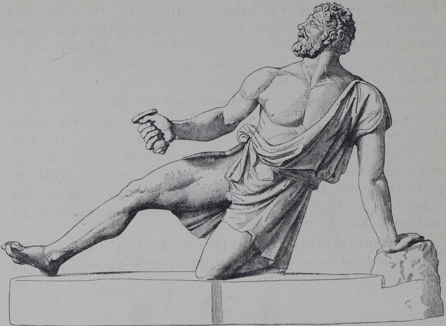
[Fig. 128. Gallier (Venedig).