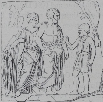
Fig. 120. Asklepiosrelief.

mit der Krankenkappe bekleideten Kranken, der in einfachem gegürteten Chiton dem Asklepios schüchtern naht, um seine Heilung zu erfliehen. Sein Pferd, von dem wir nur einen Theil des Kopfes sehen, folgt ihm. Asklepios steht in vornehmer Haltung vor ihm. Auf seine Schulter gelehnt folgt ihm seine Tochter Jaso mit dem Heiltrank. Eine Mädchengestalt, vielleicht Panakeia, nur in ihrem Untergewande erhalten, ist auf der Platte noch sichtbar. Die Platte stammt, wie auch die über dem Kranken befindliche Inschrift erweist, aus dem Ende des 5. Jahrhunderts.