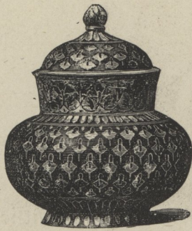
35] Indisches Zinngefäß; Bidrah-Arbeit.