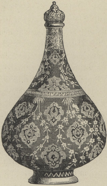
34] Persische Surahé in Fayence; Sammlung Schefer.