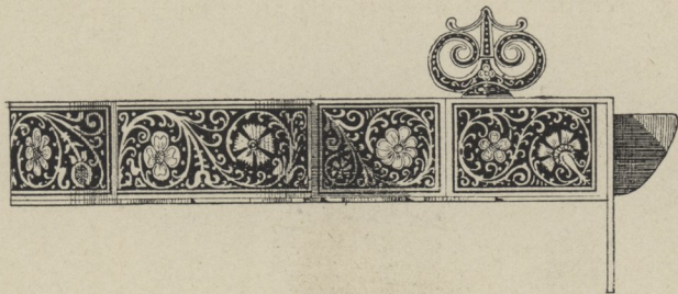
32] Detail zu Fig. 31.