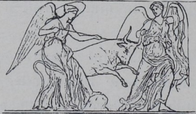
Fig. 90. Balustradenrelief.

nicht so scharf an die Westkante gerückt und dadurch eine so schwierige Aufstellung der Reliefplatten absichtlich hervorgerufen, andererseits würden die Kranzplatten, wie sonst in der Antike gebräuchlich, sicher an der Oberfläche Klammerbänder zeigen, ebenda, wo sie bestimmt gewesen, durch Reliefplatten gedeckt zu werden.