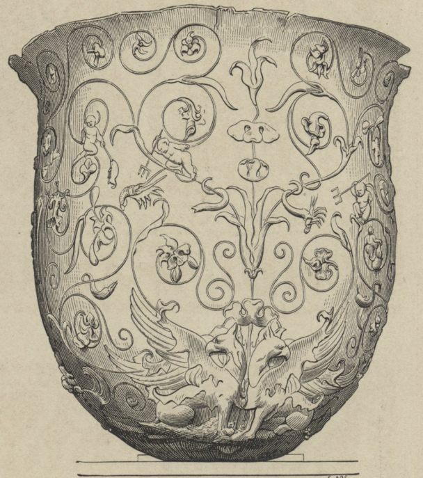
25] Römisch-antiker Milchkeffel

ihrem Wesen nach schon Abirrungen von dem Ideal der ganzen Epoche darstellen und in der Folge geradezu den Verfall des Ideals herbeigeführt haben.