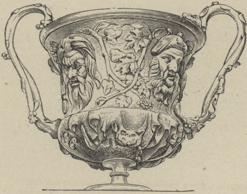
22] Römisch-antiker Trinkbecher.