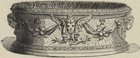
234] Fayence-Gefäß von Bernhard Palissy.