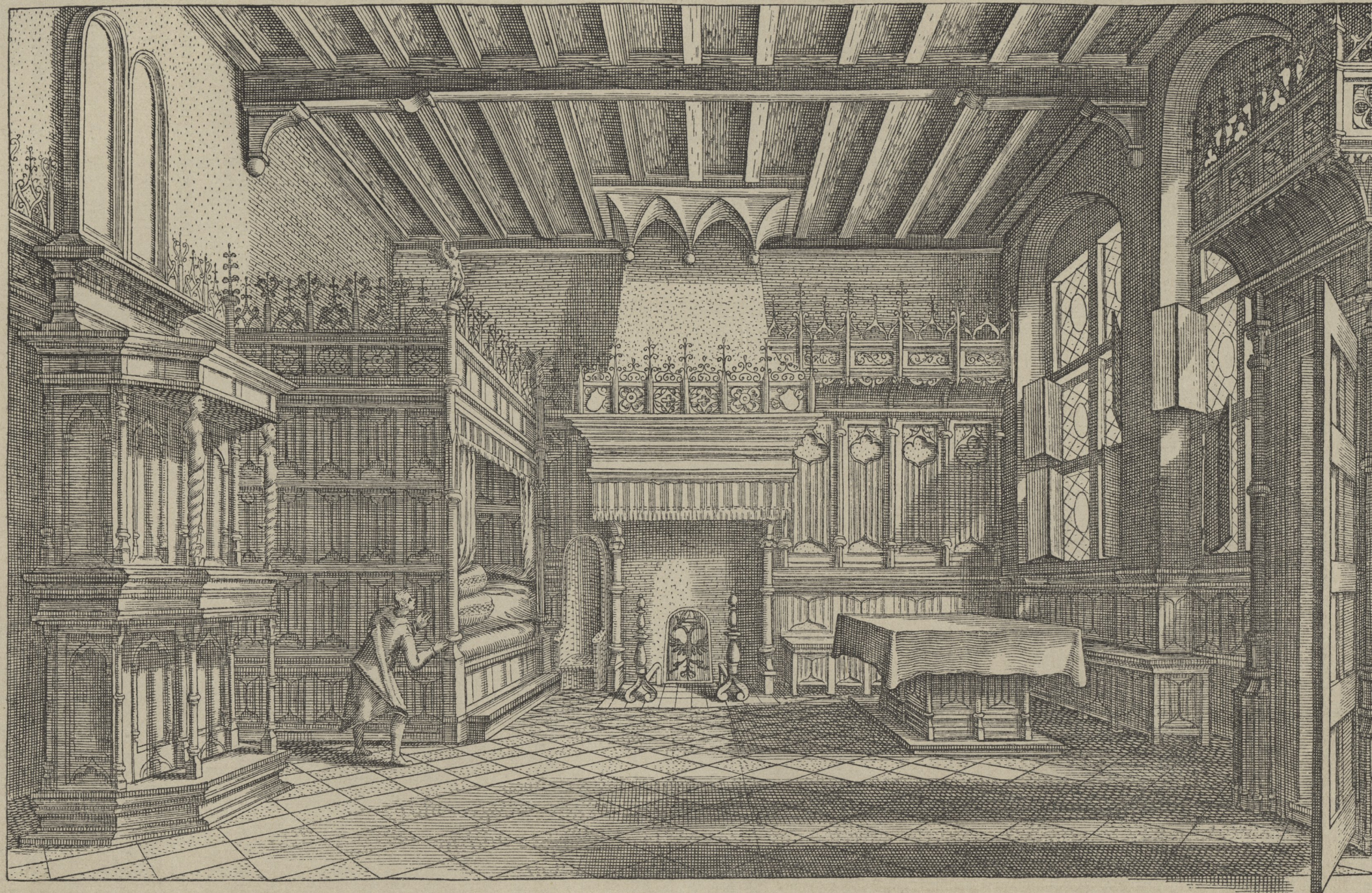
146] Spätgothifches Zimmer. Nach Vredeman de Vries.