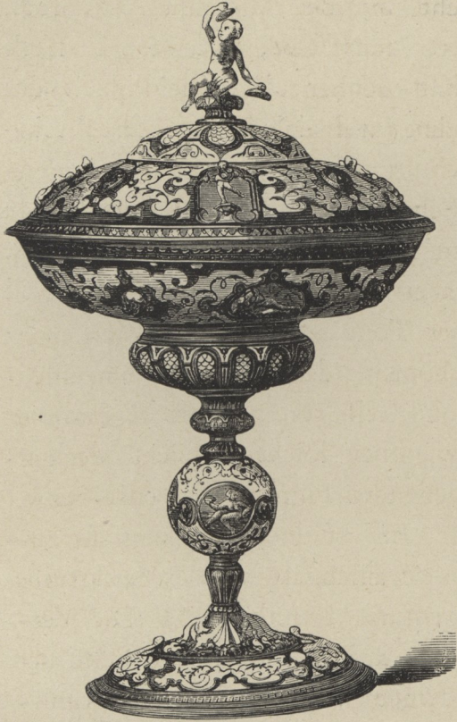
71] Emailirte Schale, galvanoplastische Reproduktion von Elkington in London.

Aehnlich wie die Farbenkugel ist auch der Farbenkegel gedacht. Wer sich für diese Figuren interessiert, wolle darüber bei Helmholtz (Seite 285), Brücke (Seite 50 ff.) und Bezold (Seite 123 ff.) nachlesen. Auch bezüglich der verschiedenen Methoden und Instrumente, um die Ergänzungen zu gegebenen Farben aufzufinden, verweise ich auf jene Werke. Der einfachste Versuch ist der Lambert'sche : Man sieht durch eine durchsichtige Platte von Spiegelglas nach einer, auf schwarzem Grunde liegenden kleinen Scheibe, welche die gegebene Farbe hat; eine andere kleine Scheibe muß man an derselben Stelle als Spiegelbild wahrnehmen. Man ändert nun die Farbe der letzteren so lange, bis beide Scheibenbilder zusammenfallend neutrales Grau geben, dann hat man ungefähr die Komplementärfarben. Bei diesem Versuch (beschrieben bei Helmholtz S. 305, Brücke S. 39, Bezold S. 95) findet übrigens eine wirkliche Addition beider Farben statt, weil wir die Lichter derselben auf einer Fläche vereinigen — allerdings, wegen der Schwäche des Spiegelbildes, nicht in so vollkommener Weise, wie bei dem in der Anmerkung S. 39 beschriebenen Verfahren.