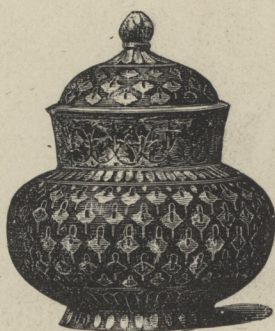
35] Indisches Zinngefäß; Bidrah-Arbeit.