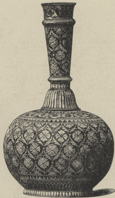
36] Indisches Zinngefäß; Bidrah-Arbeit.

wußten sich die Meister der Renaissance allerdings frei, wenn sie auch in ihrer Herzensreinheit weit davon entfernt waren, mit ihren Darstellungen unlautere Absichten zu verfolgen. Wohl aber hat man in der besten Zeit es sorgfältig vermieden, solche Geschmacklosigkeiten zu begehen, wie wir sie heute täglich noch sehen: wohin z. B. jene bunten Teppiche mit mächtigen Blumenbouquets gehören, welche wir nicht beschreiten können, ohne ideell bis an die Knöchel in Rosenblättern zu versinken oder über dornige Aeste zu stolpern. Der Schein des Reliefs hat keinen Sinn da, wo das wirkliche Relief sinnlos sein würde. Auch auf den Sitzkissen der Bänke und den Polstern der Stühle vermied man solche Extravaganzen. Für unpassend wurde es ferner gehalten, Wappen und Schilder, welche ja doch die Ehre des Hauses oder angefehener Geschlechter versinnbildlichen sollen, zum Gegenstande der Bequemlichkeit zu machen. Wenn in noch verhältnismäßig guter Zeit in Frankreich die Sitte aufkam, Stühle und Lehnstühle mit figürlichen Darstellungen,