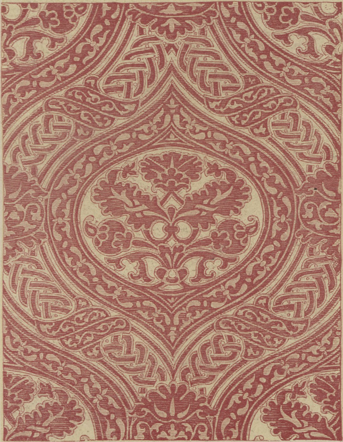
12] Stoff, kgl. bayer. Nationalmuseum München.

der Alten leiſten werden, haben wir einen gewaltigen Schritt vorwärts gethan; und wenn nun vollends die Ueberzeugung Gemeingut wird, daß wir unſer Heil in der deutſchen Renaissance des 16. und 17. Jahrhunderts zu ſuchen haben, dann muß es uns ja gelingen, über den unförmigen Moloch der Stil- und Geſchmackloſigkeit Herr zu werden.«