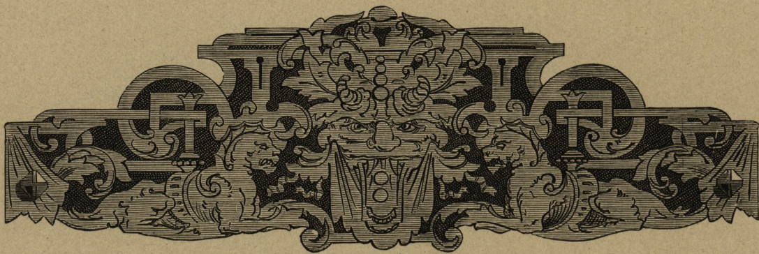
Stählerne Beschläge mit geätzten Ornamenten; entworfen von Lancelot in Paris, ausgeführt von Théron.