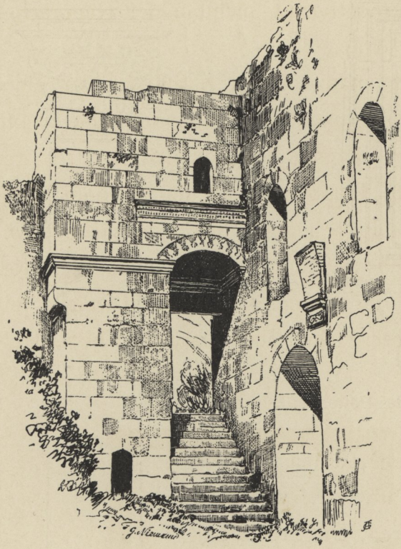
Fig. 32 Aufgang zum Portal in der Südostecke des Hofes.

sich durch ihre verschiedene Höhenlage und ihre architektonische Ausbildung. Die östliche Nische (Fig. 32), zu welcher 14 Stufen hinaufführen, ist mit einer wagrechten Steindecke versehen und zeigt gegen den Hof einen Segmentbogen. Von dem Minaret ist hier nur der Unterbau erhalten. Die westliche Tornische (Fig. 33) deckt ein spitzbogiges Kreuzgewölbe mit einer achteckigen, durch eine Steinplatte geschlossenen Öffnung im Scheitel. Über dem Kreuzgewölbe befindet sich ein oberer Raum, der vom Minaret aus betreten werden kann.