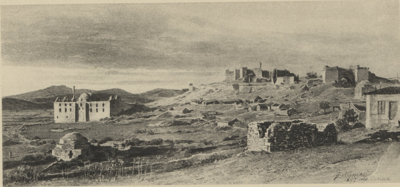
Fig. 30 Ansicht des Burgberges und der großen Moschee in Ajasoluk.