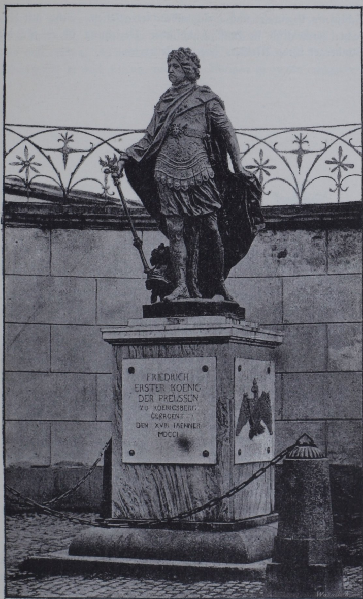
fig. 6. Statue des Kurfürsten Friedrich's III. zu Königsberg.