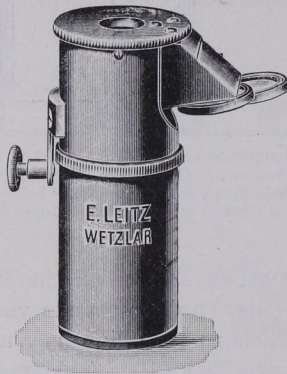
Fig. 334. Zeichenokular von Leitz, Wetzlar.

Bei ersteren handelt es sich darum, das Bild des Objektes zugleich mit der Zeichenebene zu sehen, um es auf ihr nachziehen zu können. Fig. 333 (S. 93) stellt ein Doppelprisma mit innerer spiegelnder Fläche dar. An dieser wird das vom Zeichenpapier kommende und vom Spiegel zurückgeworfene Licht ins mikroskopierende Auge geworfen, welches durch eine kleine Öffnung im Spiegelbelag des Prismas zugleich mit dem Zeichenpapier das mikroskopische Bild wahrnimmt. Noch einfacher gestaltet ist ein Zeichenokular der Firma