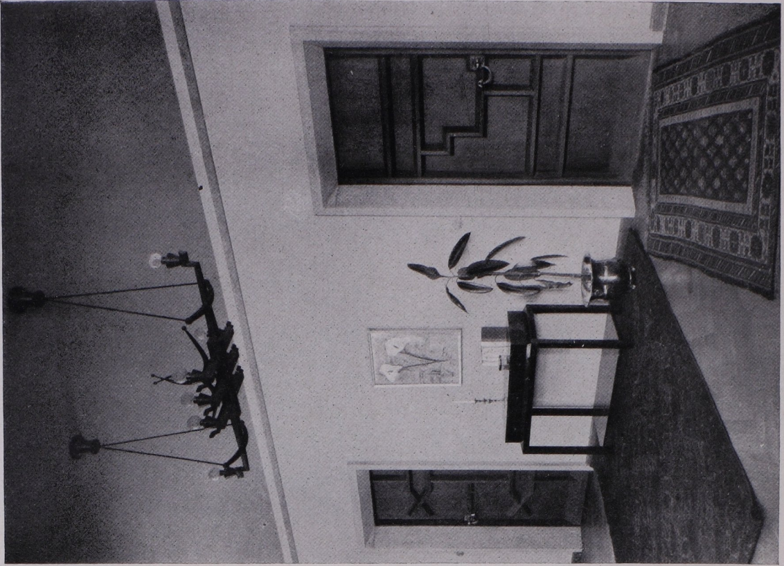
Architekt Emil Fahrenkamp, Düsseldorf