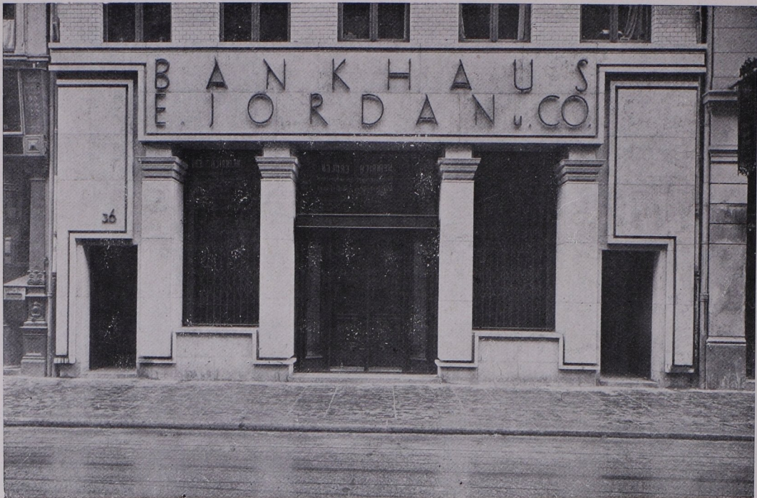
Eingang zum Bankhaus Jordan, Hamburg