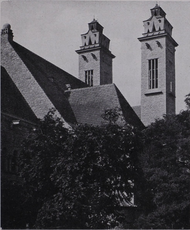
St. Michaelskirche in Saarbrücken, Ostansicht