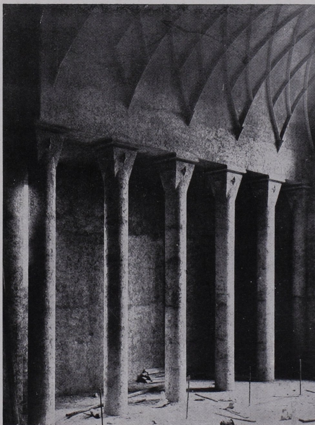
St. Michaelskirche in Saarbrücken, Altarraum Architekt Hans Herkommer, Stuttgart

Der diesem Buche verfügbare Rauminhalt erlaubt nicht, solche Andeutungen ausführlich zu belegen. Einer seiner neueren Kirchenbauten wird im Verhältnis zur Umgebung klargelegt, eine stark und wuchtig empfundene Krypta aufgezeigt. Eine Siedlungsanlage beweist die Prägnanz des Formwillens dieses Architekten, dem eine weniger absolut betonte Einstellung zum Dasein sehr wahrscheinlich erhöhte schöpferische Fähigkeiten entfesseln dürfte.