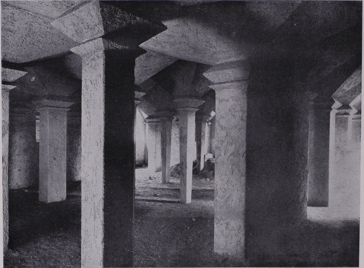
St. Michaelskirche in Saarbrücken, Krypta