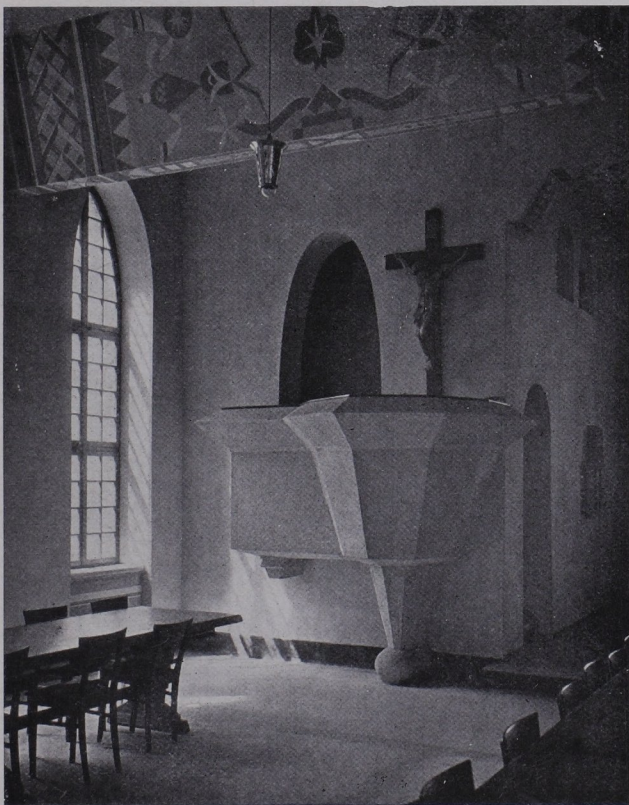
St. Paulusheim in Bruchsal, Vorlesekanzel im Speisesaal