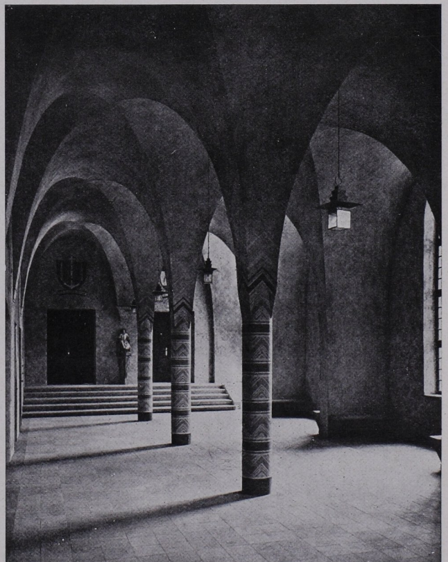
Eingangshalle Architekt Hans Herkommer, Stuttgart