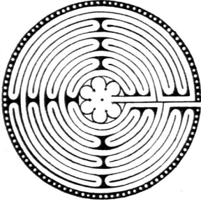
Labyrinth zu Chartres 35) .

Mailand ausgeführt. Blümlein in Passau soll ähnliche Platten anfertigen.