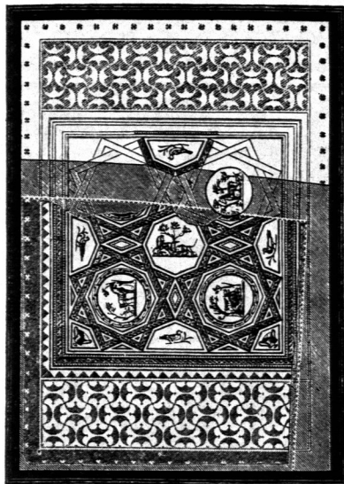
Römischer Fußboden bei Kreuznach 28) . \frac{1}{100} w. Gr.

eckigen und einem mittleren quadratischen Felde. Die seitlichen Felder sind mit einem Ornament (Fig. 70 u. 71 28) ) gemustert, welches an Motive der Frührenaissance erinnert, während das Mittelfeld Medaillons mit Tiergruppen enthält. Im übrigen sei auf die unten genannte Zeitschrift 28) verwiesen.