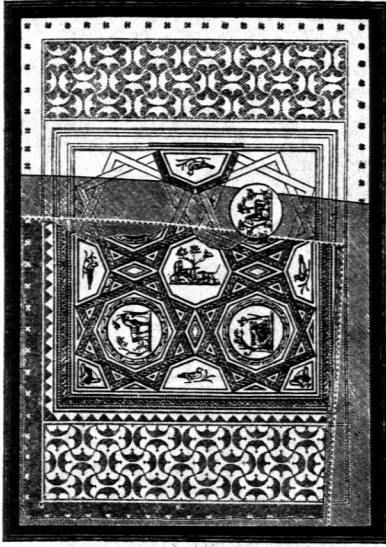
Römischer Fußboden bei Kreuznach 28) . \frac{1}{100} w. Gr.

eckigen und einem mittleren quadratischen Felde. Die seitlichen Felder sind mit einem Ornament (Fig. 70 u. 71 28) ) gemustert, welches an Motive der Frührenaissance erinnert, während das Mittelfeld Medaillons mit Tiergruppen enthält. Im übrigen sei auf die unten genannte Zeitschrift 28) verwiesen.