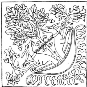
Fliese aus dem Kloster Heilsbrunn 15) .

Weckenmotivs, teils Rosetten, wie z. B. in Fig. 55 15) aus einem Haufe bei Bacharach, teils Bandornamente, deren Flächen mit Pflanzenornament ausgefüllt sind. Unglasierte Fliesen kommen nur noch selten vor; doch wird die Farbenpracht der spanischen, italienischen und französischen Majolikafiesen nicht erreicht. Das Format ist meistens 13 bis 14 cm bei 2 cm Dicke. Ueber andere vereinzelt vorkommende Fliesenarten muß auf das früher genannte Werk von Forrer verwiesen werden.