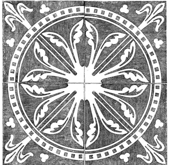
Fliese aus der Kathedrale zu Laon 10) .