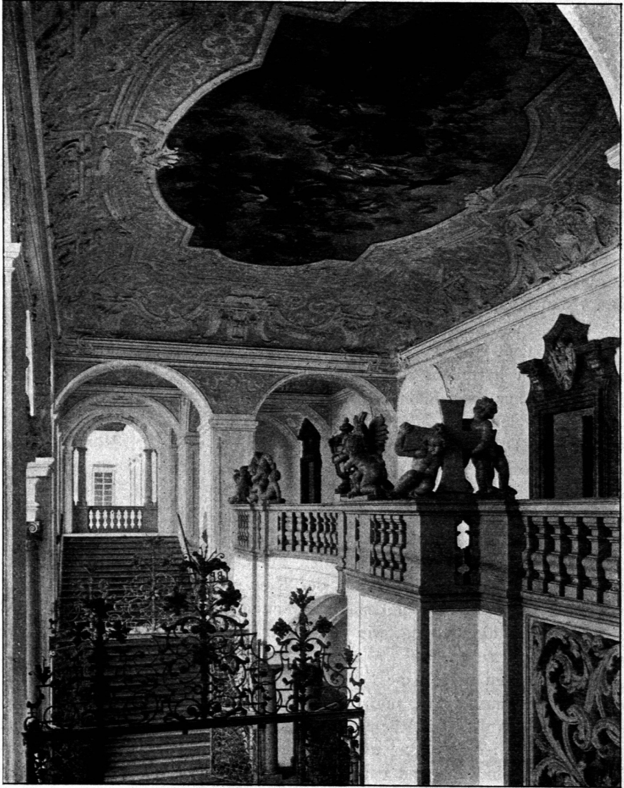
Vom Treppenhause des Stiftes St. Florian zu Wien B. Ling.

wurden. Ihnen folgten an den Gewölben die Glorien, Gott Vater, Sohn oder die ganze Dreieinigkeit nebst Maria und dem Engelschor. Sie ordneten sich nach Art der Gewölbe mit den Häuptern, wie jene Adler, nach der Haupttür, den Eintretenden entgegengerichtet, mit den Füßen dem Sanktuarium zugekehrt, über dem sie schweben.