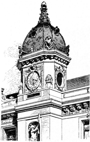
Vom Curhaus zu Monte Carlo 103) .

sich das Gesamtdach zusammensetzt, gehören alsdann Cylinderflächen an und stoßen in nach außen convex gekrümmten Gratlinien an einander. Solche Kuppeldächer wirken am günstigsten, wenn der Grundriß ein regelmäßiges Vieleck bildet; keinesfalls darf eine der Grundrißabmessungen die übrigen wesentlich überragen. Die Gestaltung solcher Dächer ist eine sehr mannigfaltige.